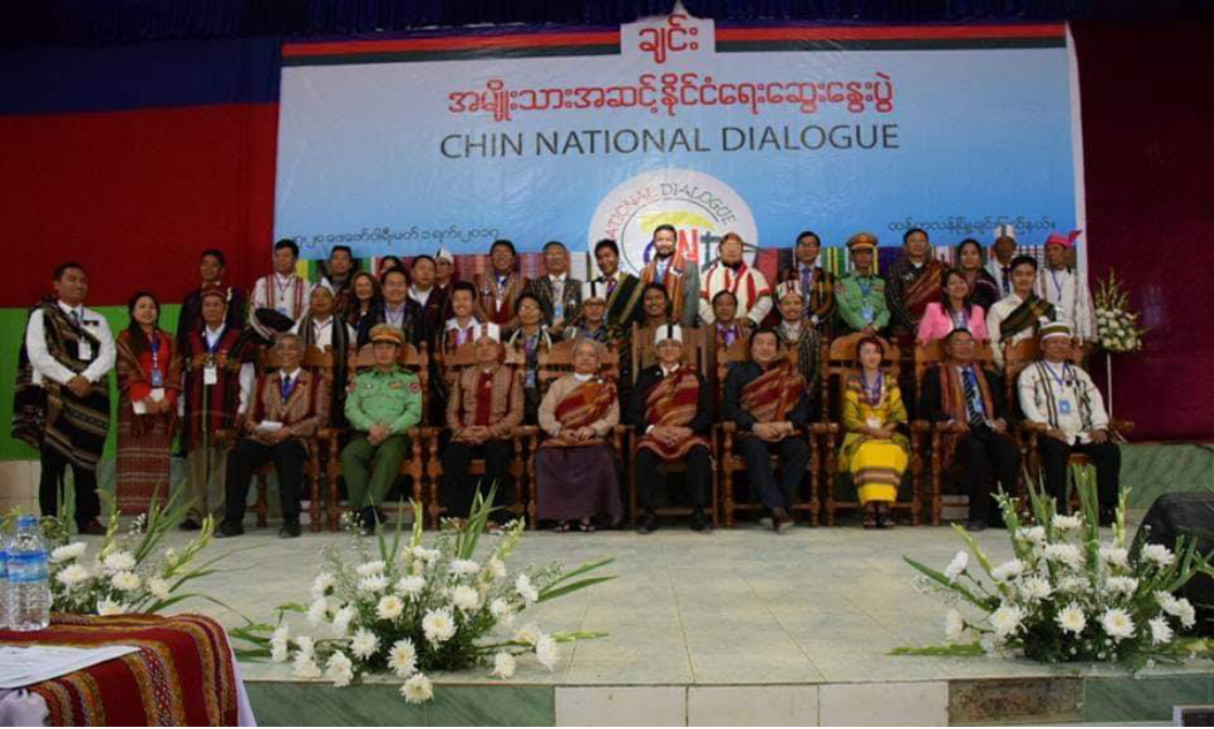
ချင်းအမျိုးသားအဆင့် နိုင်ငံရေးဆွေးနွေးပွဲ (Chin National Dialogue) ၏ သဘောထားအမြင် စုစည်းမှုများ ချင်းပြည်နယ်၊ ထန်တလန်မြို့၊ ၂၀၁၇ ခုနှစ်၊ ဖေဖော်ဝါရီလ (၂၇) ရက်မှ မတ်လ (၁) ရက်အထိ