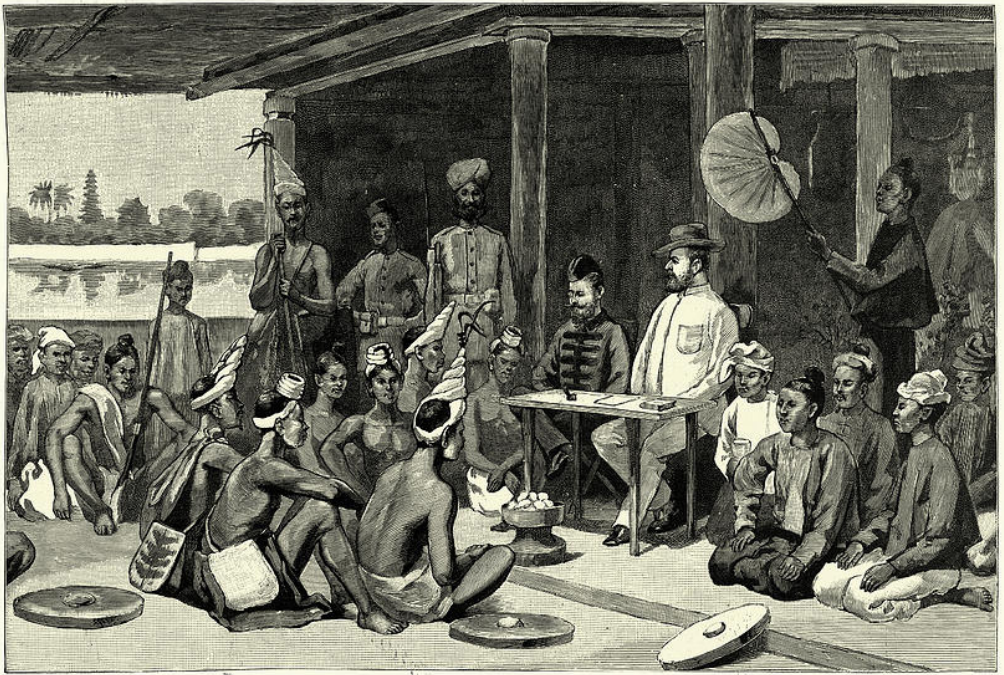
MAJOR RAIKES, DEPUTY-COMMISSIONER OF CHINDWIN, MEETING THE CHIN CHIEFS AT IN DIN WITH THE CHINS IN UPPER BURMA