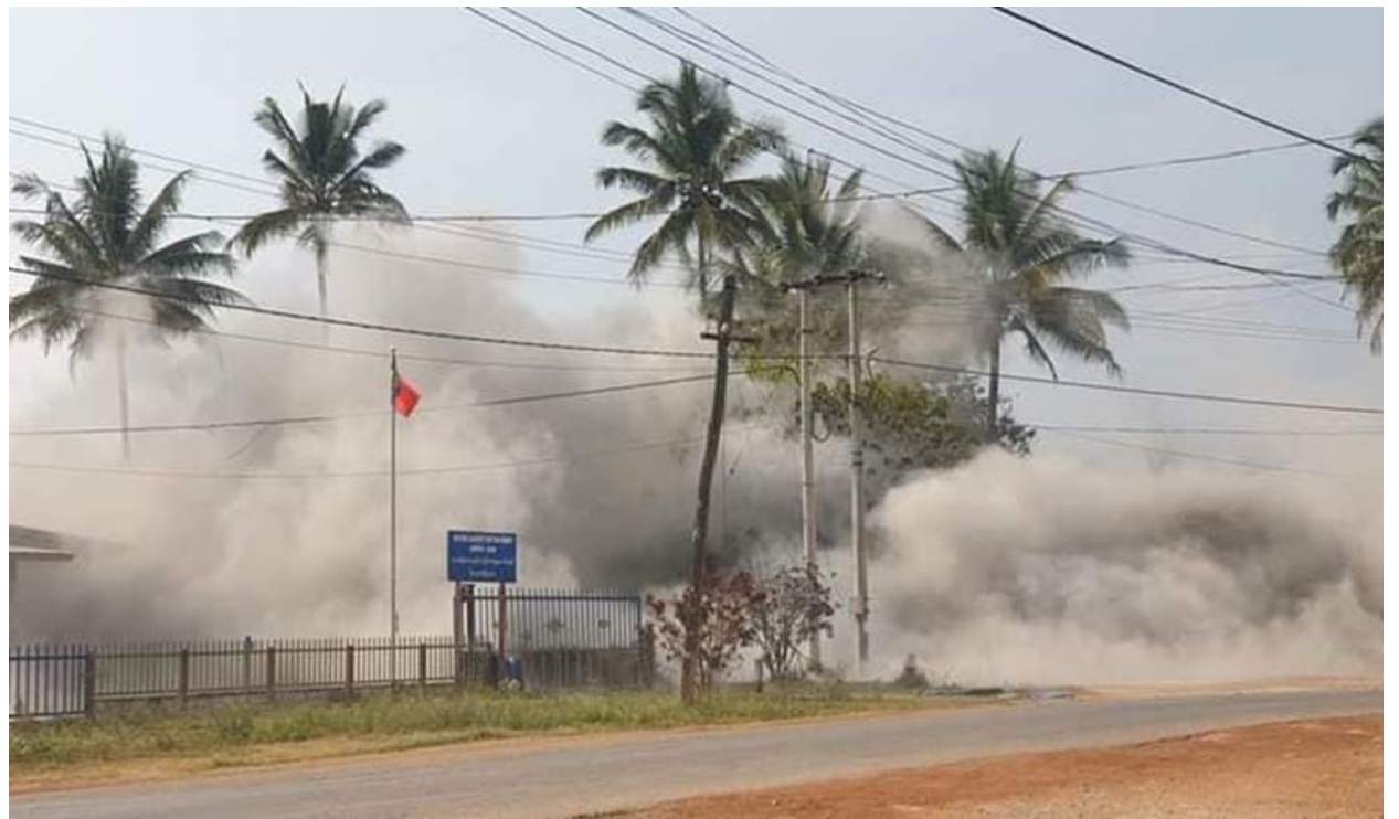
စကစမှ ပစ်လိုက်သော အတွဲလိုက်ခုံးများ ဒေါင်ခါးရပ်ကွက်တွင် ကျရောက်ပေါက်ကွဲ၊ ဒီးမော့ဆို

KNDF မှ ရရှိသော သတင်းအချက်အလက်အရ တာဝေးပစ် လျှော့ခုံးအတွဲလိုက် ပစ်ခတ်မှုသည် ဖေဖော်ဝါရီလ ၁၆ ကတည်းက စတင်အသုံးပြုပုံရပြီး ထိုအချိန်တွင် အတွဲလိုက် ကျရောက်ပေါက်ကွဲ နေသော လက်နက်ကြီးအား တွေ့မြင်ခဲ့ကြရသည်။ ကရင်နီပြည်တွင် တာဝေးပစ် အတွဲလိုက် လျှော့ခုံး (၃)စီးရှိပြီး လက်ရှိ ခမရ ၁၀၂ တပ်မှ တခုအပါအဝင်ဖြစ်သည်။