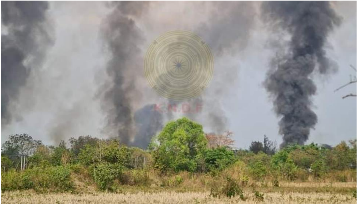
စကစမှ သေးဆူလဲကျေးရွာအား မီးရှို့ဖျက်စီးသည့်ပုံ